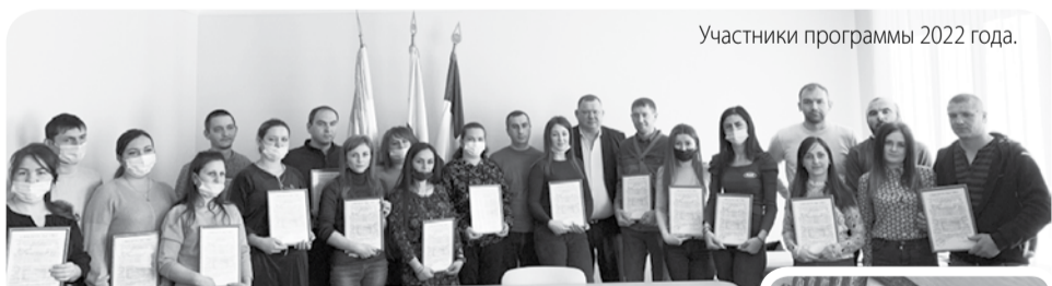
Участники программы 2022 года.