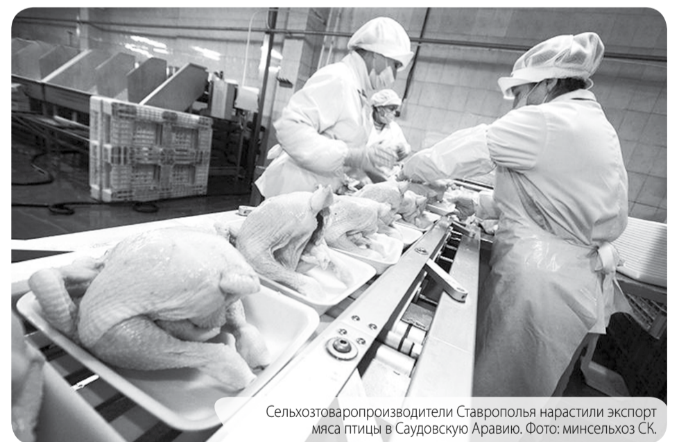
Сельхозпроизводители Ставрополья нарастили экспорт мяса птицы в Саудовскую Аравию.

НАЦИОНАЛЬНЫЕ ПРОЕКТЫ РОССИИ МЕЖДУНАРОДНАЯ КООПЕРАЦИЯ И ЭКСПОРТ