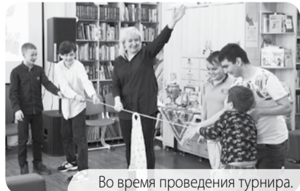
Во время проведения турнира.

Благодаря этим мероприятиям у ребят раскрываются такие качества, как ответственность, умение работать в команде, стремление к победе и сплочённость.